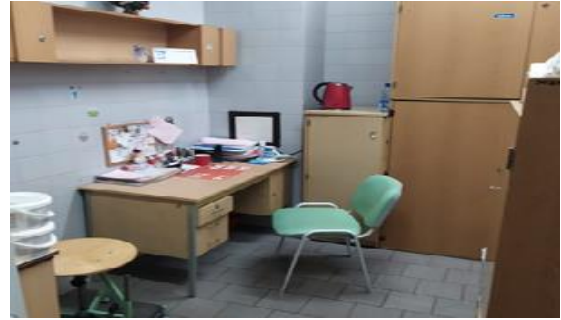
Pomieszczenie Pododdziału Dializoterapii