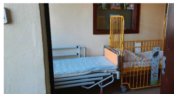
Pomieszczenie Kliniki Okulistyki