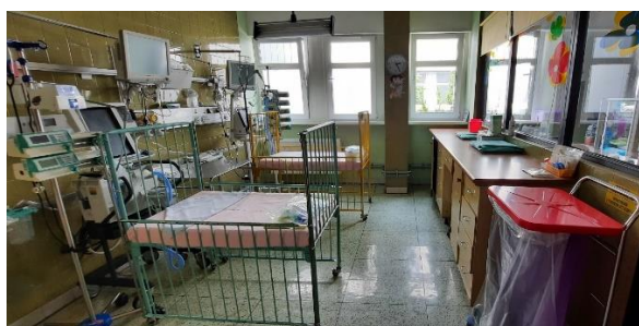
Pomieszczenie Kliniki Anestezjologii i Intensywnej Terapii Medycznej