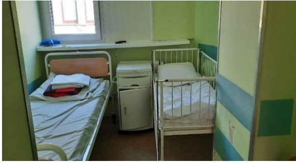
Pomieszczenie Kliniki Otolaryngologii