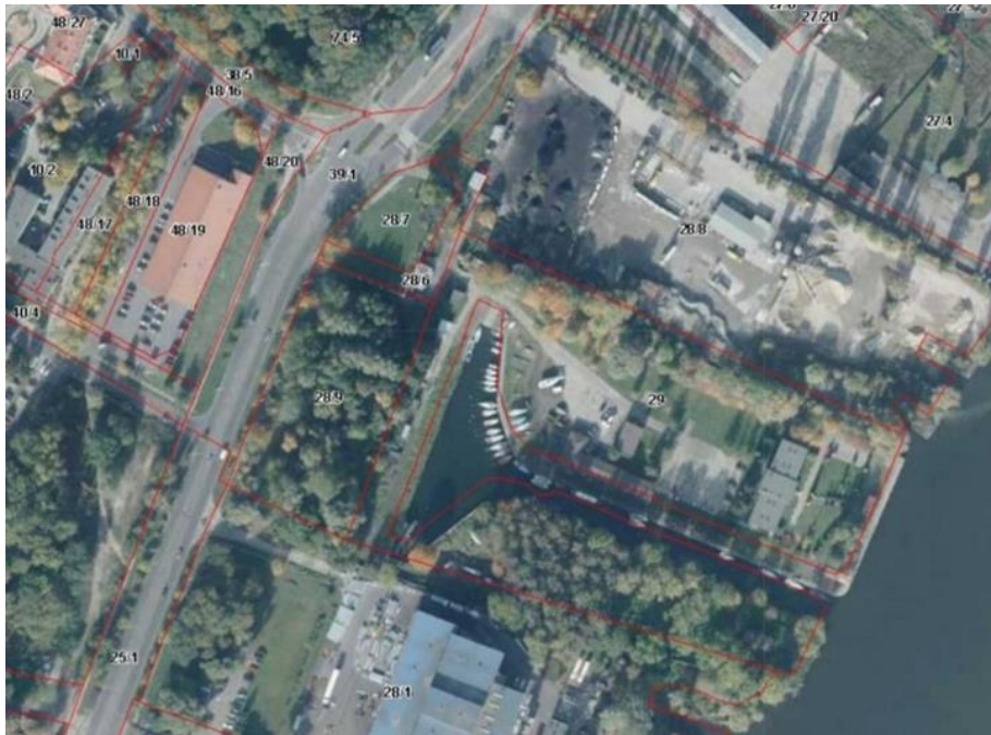
Zdjęcie nr 1. Topografia działki nr 29 i nr 28/8, obręb ewidencyjny 3025 Szczecin Nad Odrą 25.