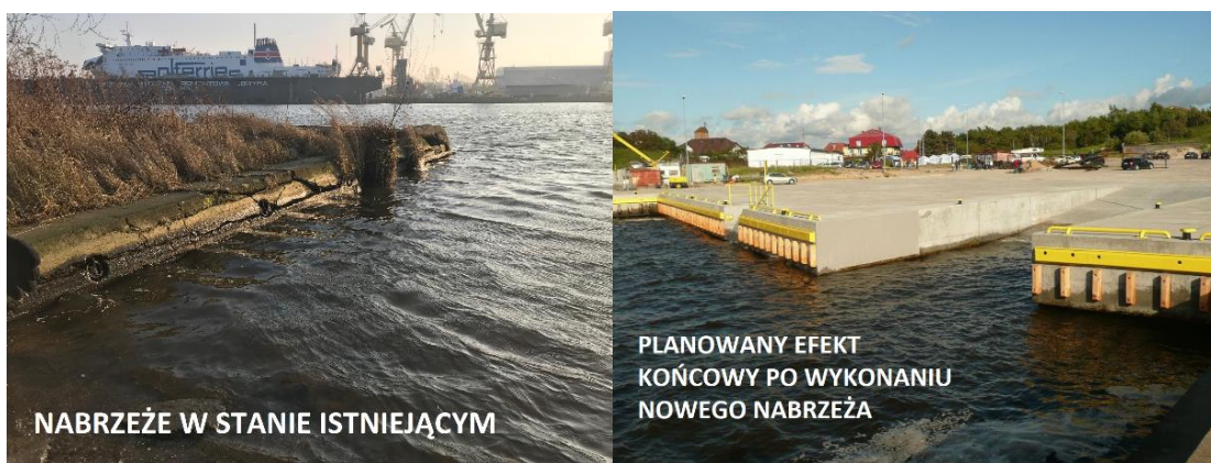
Zdjęcie nr 3. Nabrzeże

Na działce nr 28/8 jest planowana budowa nabrzeża typu ciężkiego od strony Odry oraz przystosowanie jego konstrukcji w miejscu planowanej drugiej platformy szkoleniowej wraz z infrastrukturą towarzyszącą (oświetlenie, energia elektryczna, woda). Nabrzeże będzie przystosowane do cumowania statku szkolno-badawczego m/s „Nawigator XXI”, którego Akademia jest armatorem, statków SAR (np. Kapitan Poinc). Na nabrzeżu od strony północnej powstanie kompleks platform w konstrukcji stalowej ażurowej do szkolenia z zakresu ratownictwa morskiego.