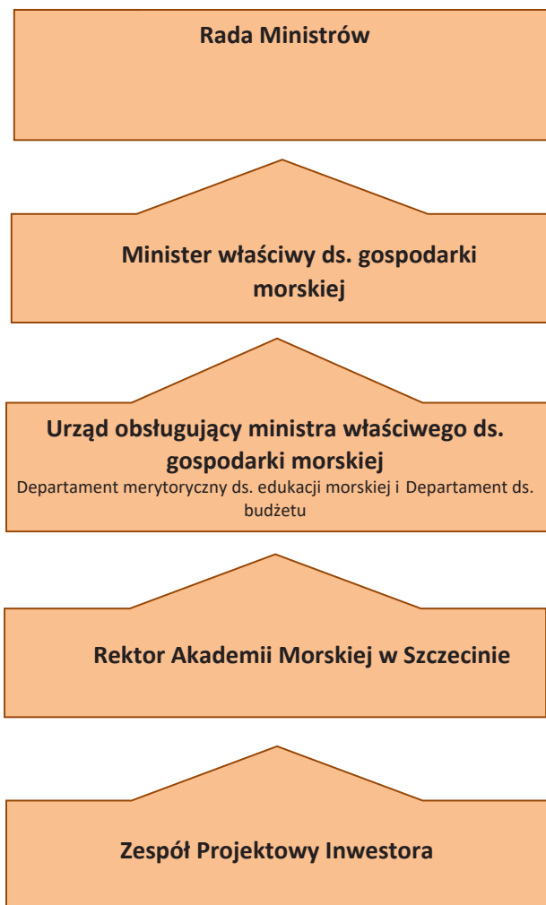
Rys. 3. Schemat przepływu informacji w systemie sprawozdawczości Programu.

Stąa obecność na miejscu budowy realizowanych obiektów w ramach Programu przedstawiciela Zespołu Inwestora, sprawującego bezpośredni nadzór, będzie wspomagana wizytacjami na miejscu realizacji Programu przedstawiciela ministra, gdzie przede wszystkim będzie oceniany stan prac, tj. rzeczowa realizacja projektu. Minister będzie nadzorować realizację Programu przez weryfikację sprawozdań z jego realizacji przedstawianych przez AMS . Za przygotowanie, realizację i monitorowanie Programu będzie odpowiadać AMS przy wsparciu osób i podmiotów zewnętrznych, zatrudnianych bezpośrednio w związku z jego realizacją.