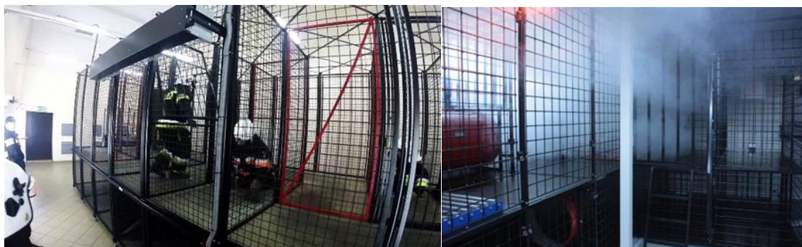
Zdjęcie nr 2. Komora rozgorzeniowo-dymowa.

Realizacja przedsięwzięcia uwzględni poszerzenie Kanału Młyńskiego oraz budowę nabrzeży typu lekkiego od strony południowej i zachodniej oraz nabrzeży typu ciężkiego od strony wschodniej (wzdłuż Odry), przebudowę nabrzeży w rejonie planowanej platformy do ćwiczeń ratownictwa morskiego przy Kanale Młyńskim wraz z infrastrukturą towarzyszącą (oświetlenie, energia elektryczna, woda).