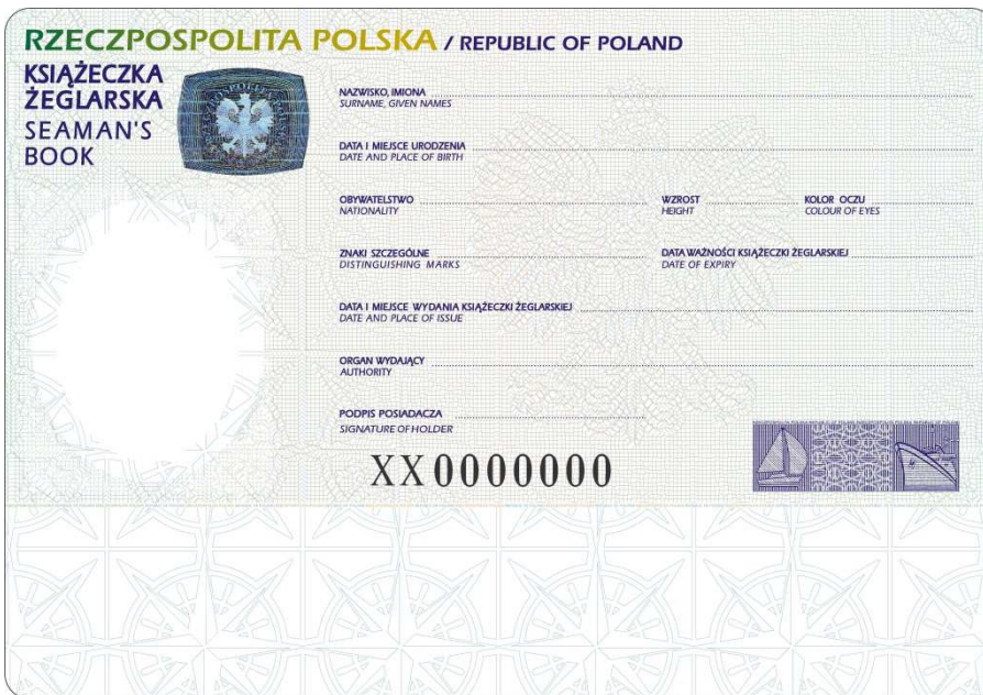
Naklejka personalizacyjna do książeczki żeglarskiej