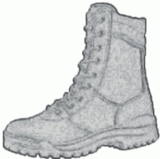
Buty wysokie na grubej podeszwie.