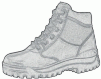
Buty letnie na grubej podeszwie.