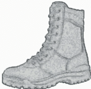
Buty wysokie na grubej podeszwie.