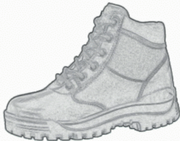
Buty letnie na grubej podeszwie.

Czapka typu dokerka w kolorze szarozielonym z wizerunkiem orla w koronie ze wstęgą i napisem „SŁUŻBA CELNA”, wykonanymi haftem maszynowym.