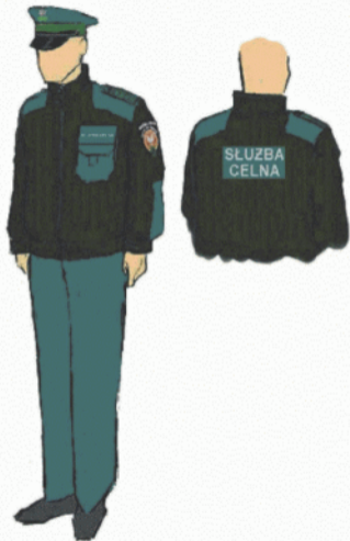
Funkcjonariusz w ubiorze służbowym, ubrany w sweter typu polar z obszyciem.