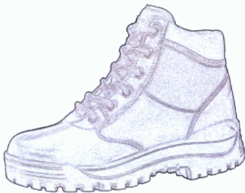
Buty letnie na grubej podeszwie.

Funkcjonariusz będący członkiem załogi jednostki pływającej w ubiorze koloru ciemnoniebieskiego, ubrany w spodnie typu bermudy, koszulobluzę z krótkim rękawem, czapkę polową letnią, buty letnie na grubej podeszwie.