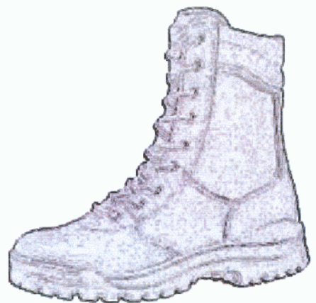
Buty wysokie na grubej podeszwie.