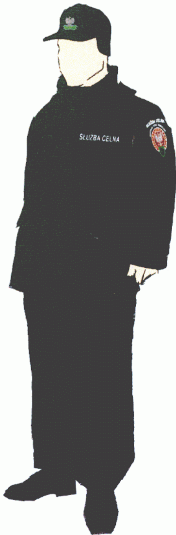
Funkcjonariusz w ubiorze specjalnym koloru czarnego – komplecie całorocznym, z czapką połową zimową i butami wysokimi na grubej podeszwie.