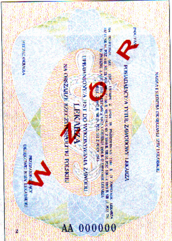
Strona 2 — wzór II