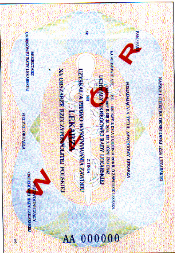
Strona 2 — wzór I